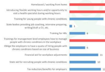
Figure 28: Measures helpful to find jobs

What measures are needed to increase employment among young patients?