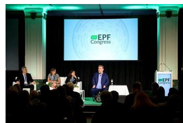
Séance plénière : allocution d'ouverture (sur la photo, David Lega, eurodéputé)

Le Congrès a accueilli plus de 300 délégués , dont des défenseurs de patients, des professionnels de la santé, des ONG dans le domaine de la santé, des universitaires, des représentants de l'industrie et des institutions nationales. Des scénarios de la vie réelle sur l'auto-gestion , des études de cas montrant la valeur ajoutée apportée par les idées des patients et l'importance d'intégrer la participation des patients à l'éducation médicale ont figuré parmi les sujets abordés.